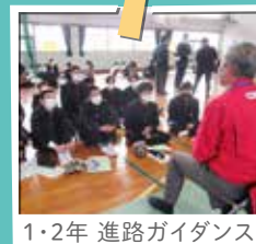
1・2年 進路ガイダンス