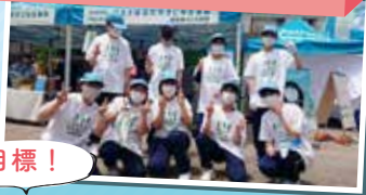
R5 第39回年次大会「活動報告優秀賞」受賞

こんにちは!!茶道クラブです。私たちは男女関係なく明るく楽しく活動しています。主な活動内容は茶道の作法を学んだり、お茶をたてそれを自分で飲んだりします。茶道部は活動を始めたばかりなので上手でも上手でなくても関係ない!運動が苦手な人でも気軽に入って来てください。