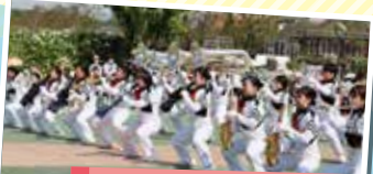
R5 吹奏楽コンクール・マーチング 金賞