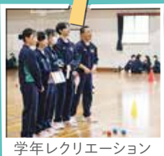
学年レクリエーション