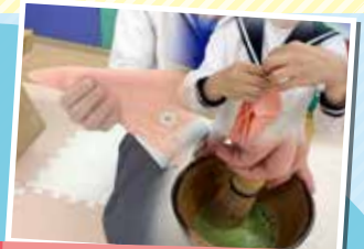
まごころ、おもてなし 日本文化 茶の道