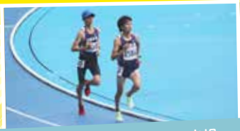
R5 インターハイ 男子800m出場