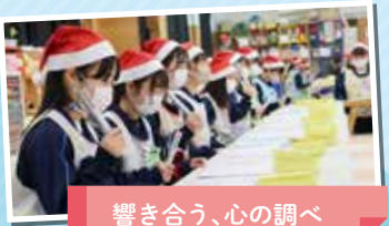
響き合う、心の調べ