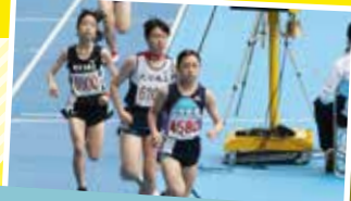
R5 全国高校駅伝 県予選 第3位

陸上競技は、ただ走るという単純動作の繰り返しに思われがちですが、その実何より奥深いです。フォーム・メンタル・コンディション・展開など、様々な要素が結果につながっています。3年間は何事も成さずにはとて長いですが、私たちと一緒に汗を流し、目標を持って充実した3年間をすごしませんか？