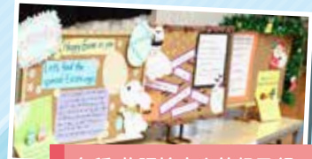
各種 英語検定上位級取得