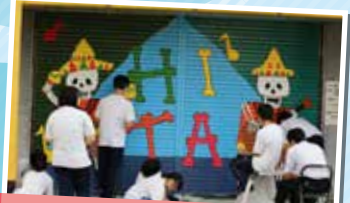
R5 甲子園県予選 表紙原画コンクール 最優秀賞