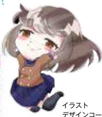
イラスト デザインコース